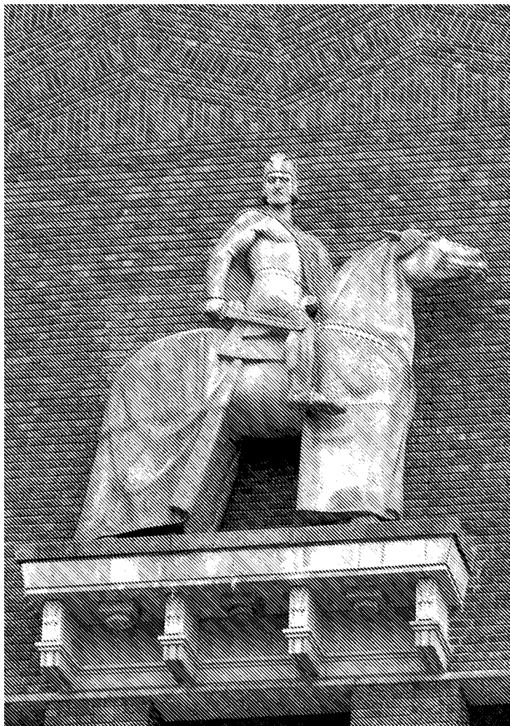
Kralj Harald na zidu gradske vijećnice u Oslu.