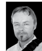
Piše: DARKO VLAHOVIĆ

Rođen 1971. u rumunjskom gradiću Dragoiestiju, Bradatan je dovoljno star da se sjeća diktature Nicolae Ceausescua. U Bukureštu je studirao pravo i filozofiju, da bi krajem devedesetih otišao na doktorat u Englesku, odakle se preselio u Sjedinjene Države gdje i danas živi. Trenutno radi kao profesor humanističkih znanosti na Sveučilištu Texas Tech, a u međuvremenu je kao