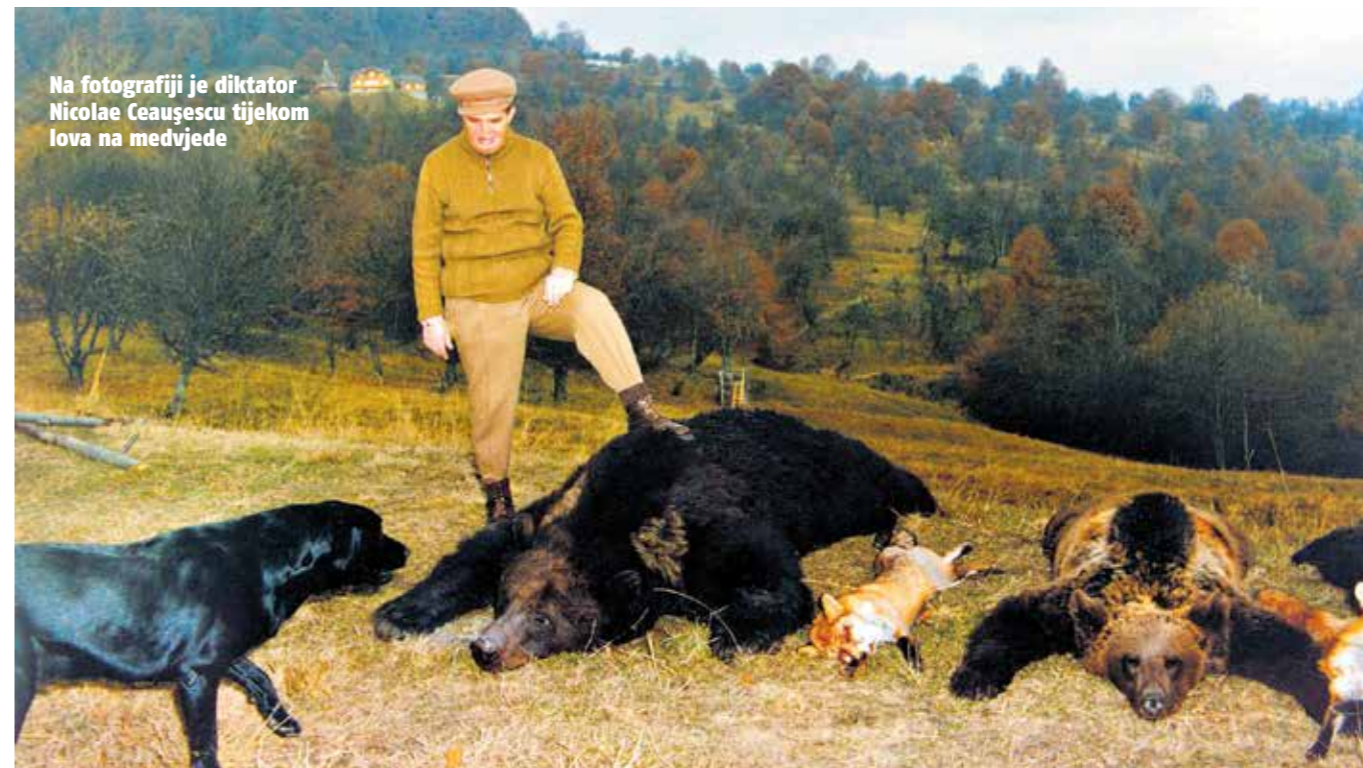
Na fotografiji je diktator Nicolae Ceaușescu tijekom lova na medvjede

Možda mislite da ste me ovdje uhvatili, ali niste. Jer pisanje nije djelovanje, to je samo još jedan oblik kontemplacije. "Ne raditi ništa", o čemu govorim u knjizi i što neprestano hvalim, zapravo znači činiti prilično malo: čitati, pisati, razmišljati, hodati - posebno hodati. Ali sve to ne treba raditi pragmatično, radi boljeg uživanja u svijet i ovladavanja njime, nego kontemplativno, radi boljeg razumijevanja svijeta. A to je velika razlika. Što se tiče drugog dijela vašeg pitanja - zašto bismo uopće djelovali - na njega neću čak ni pokušati odgovoriti. Prepustit ću vašim čitateljima, svakome od njih, da smisli i formulira svoje osobne odgovore.