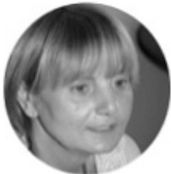
POGLED S LIJEVA