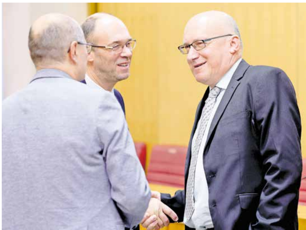
Bilo bi naivno misliti da se destabilizacija Crne Gore, Kosova, a pogotovo Bosne i Hercegovine ne odražava na našu nacionalnu sigurnost, upozorava naš sugovornik

U Hrvatskoj će također biti superizborna godina s europskim, parlamentarnim i predsjedničkim izborima. Razumije se da ću u svim tim izborima podržati HDZ, a još ćemo vidjeti u kojem svojstvu. •