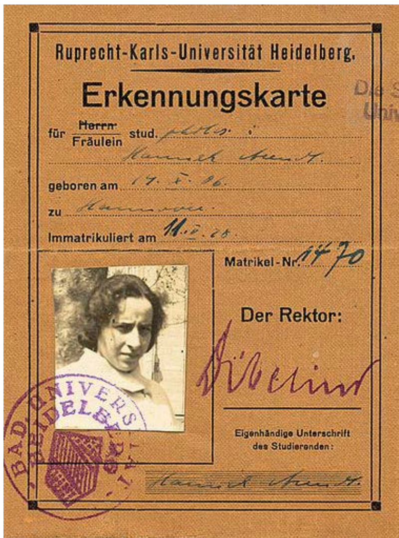
Studentska iskaznica: Nakon Marburga Arendt odlazi studirati u Heidelberg kod Karla Jaspersa

Treće razdoblje intenzivnih kontakata počinje 1966. godine, no odnos je sada već isključivo prijateljski: Hannah Arendt javlja se Heideggeru iz Basela i opisuje mu Kleeovu izložbu (Klee je bio jedan od dvojice likovnih umjetnika kojima se Heidegger bavio), iz svoje američke perspektive komentira rat u Vijetnamu, piše s odmora iz mjesta Tegna u švicarskom Ticinu, priča mu o studentima koji uče njemački “da bi mogli čitati Heideggera”.