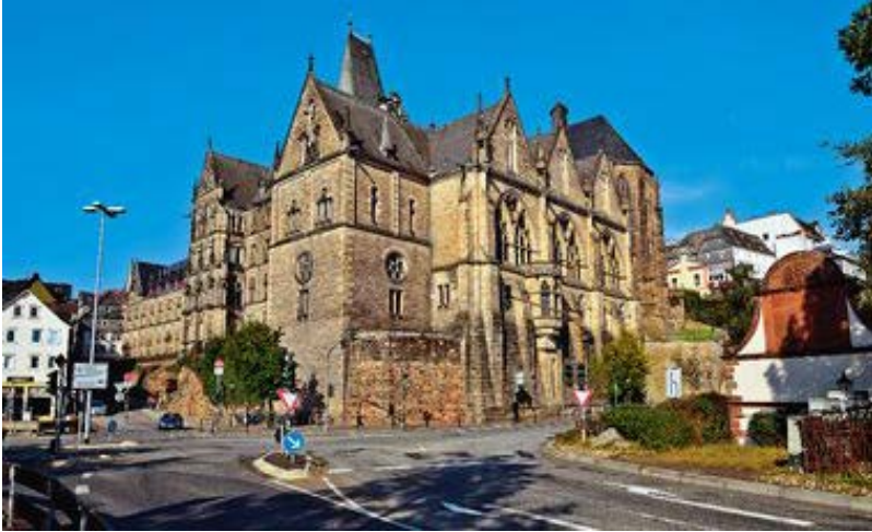
Hannah Arendt studirala je filozofiju na Sveučilištu u Marburgu, a Heidegger je ondje bio profesor

Heidegger , 36-godišnji profesor i oženjeni otac dvoje djece. Mjesto radnje: mali sveučilišni grad Marburg. A osoba s kojom je imao dogovorene tajne znakove, u vidu uključene ili isključene svjetiljke, bila je Hannah Arendt , 19-godišnja židovska studentica koja će tri desetljeća kasnije postati ništa manje poznata od svoga učitelja i ljubavnika.